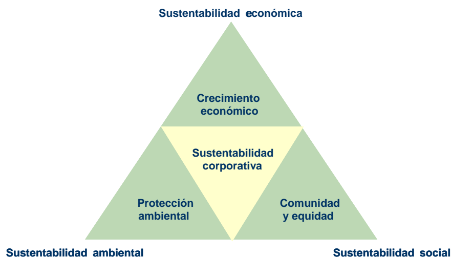
Figura 1 – Sustentabilidad corporativa según el abordaje de la Línea Triple.

Al elaborar las directrices presentadas en este documento se enfocaron las dimensiones ambiental y social, ubicadas en la base de la pirámide de sustentabilidad, ya vez que la dimensión económica se viene infiltrando naturalmente en las acciones de la compañía.